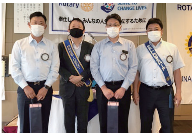
7 月会員誕生日 (7 / 1 分)